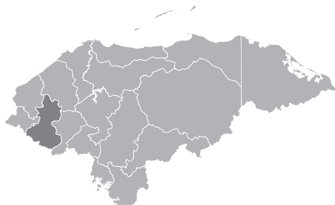
Ubicación del departamento de Lempira