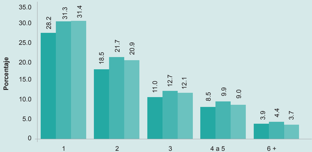
GRÁFICO 10: NÚMERO DE HIJOS VIVOS POR AÑO A NIVEL NACIONAL